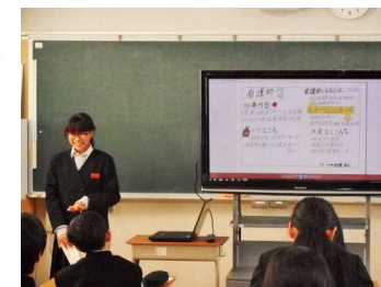
職業調べ発表会の様子